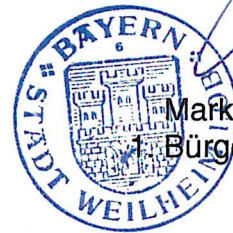
Markus Loth Bürgermeister

Die vereinfachte Änderung wurde am 09.07.2019 gemäß §§ 10 und 13 BauGB als Satzung beschlossen.