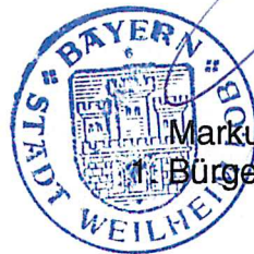
Markus Loth Bürgermeister

Die Bekanntmachung des Satzungsbeschlusses erfolgt im Amtsblatt der Stadt Weilheim i.OB vom 05.08.2019 , Nr. 18 , womit die Änderung Rechtskraft erlangt. Der geänderte Bebauungsplan wird im Stadtbauamt zu jedermanns Einsicht bereitgehalten.