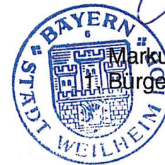
Markus Loth Bürgermeister